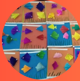
III - Std