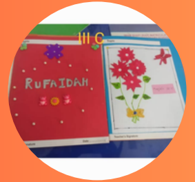
V - Std