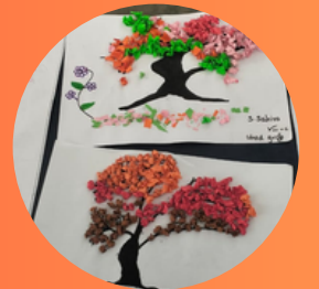
VIII - Std