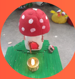
VII - Std