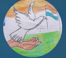
ர.ஜாபிரா (V Std)