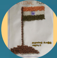
அ. முஹம்மது ஃபாஇஜ் (II Std)