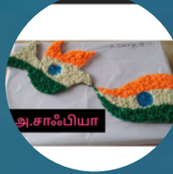
அ. சஃபியா (III Std)