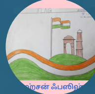
அ. அஹ்சன் ஃபஸிஹ் (IV Std)