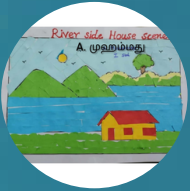
அ. முஹம்மது (I Std)