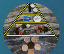
A.Afiya V STD