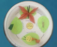
A. Nafeesa IV STD