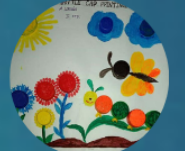
A.Unais III STD